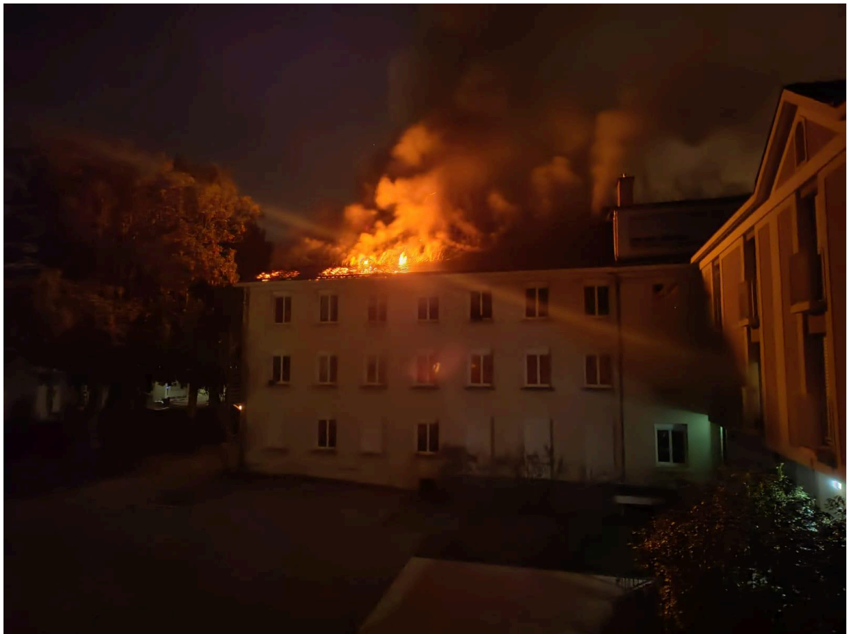
Photo prise de nuit

Fondacio | L'Esvière - 2 rue de l'Esvière 49100 ANGERS