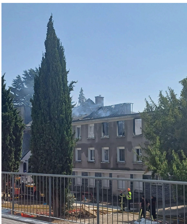
Photo prise de jour après maîtrise de l'incendie