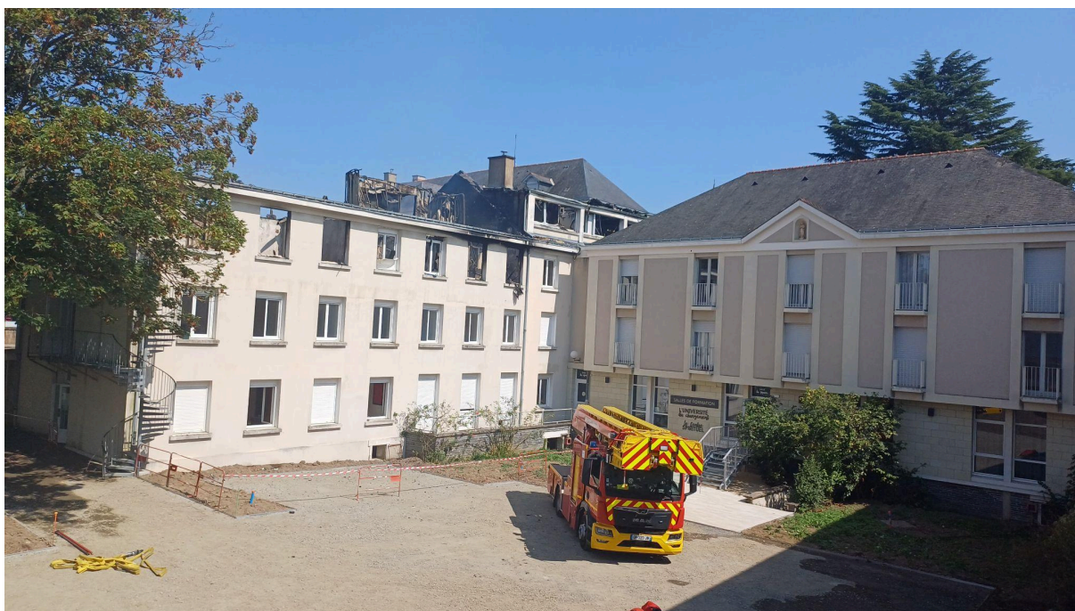
Photo de jour après maîtrise de l'incendie